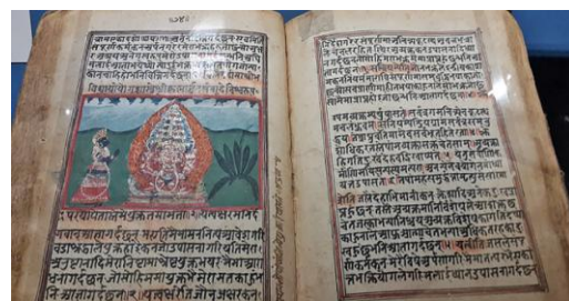
Oude boeddhistische tekst in Sanskriet

Linguïstiek. Deze studie gaat over de ontwikkeling van talen.